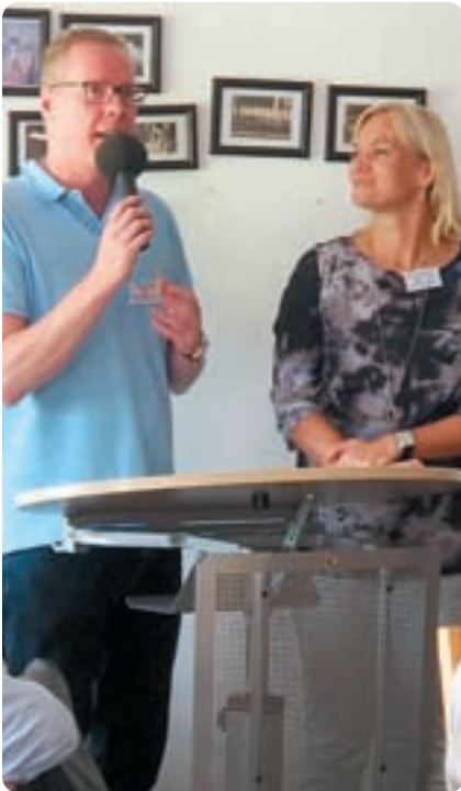
FIFA-Schiedsrichterin Bibiana Steinhaus stellte sich den Fragen von Moderator Manfred Finger.

Jungen mit Migrationshintergrund ansprechen möchte. „Sprache ist ein Schlüssel zur Integration. Sprach- und Lesekompetenz stehen zu Recht im Mittelpunkt vieler Anstrengungen um gleichberechtigte Teilhabe am gesellschaftlichen Leben. Die aktuellen Herausforderungen in Zusammenhang mit den vielen nach Deutschland geflüchteten Menschen spielen dabei sicherlich eine besondere Rolle“, betonte Umbach.